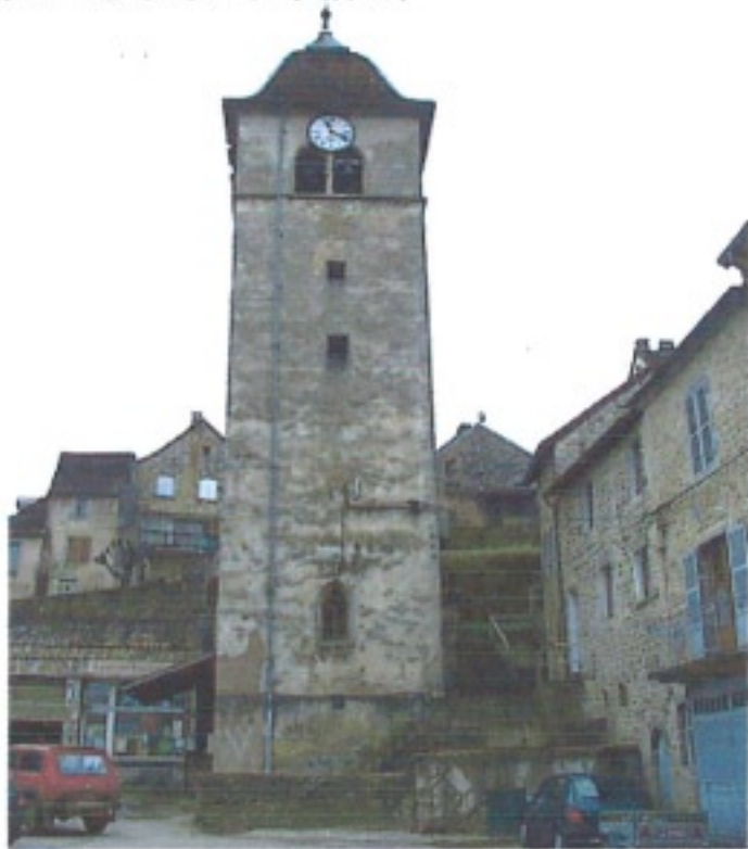
Etat antérieur du beffroy