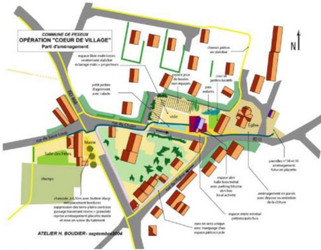
Plan des aménagements de la traversée et des espaces publics du centre