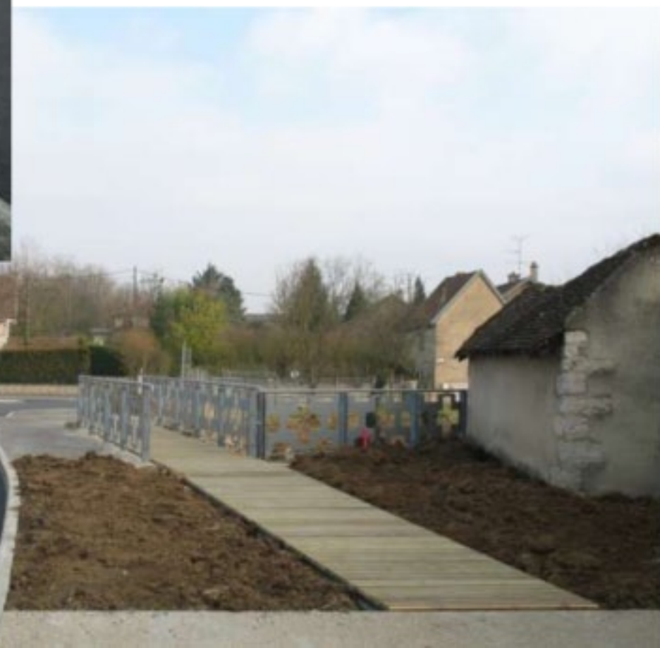
Vue de la rue, de la Place de l'Eglise et de la passerelle piétonne