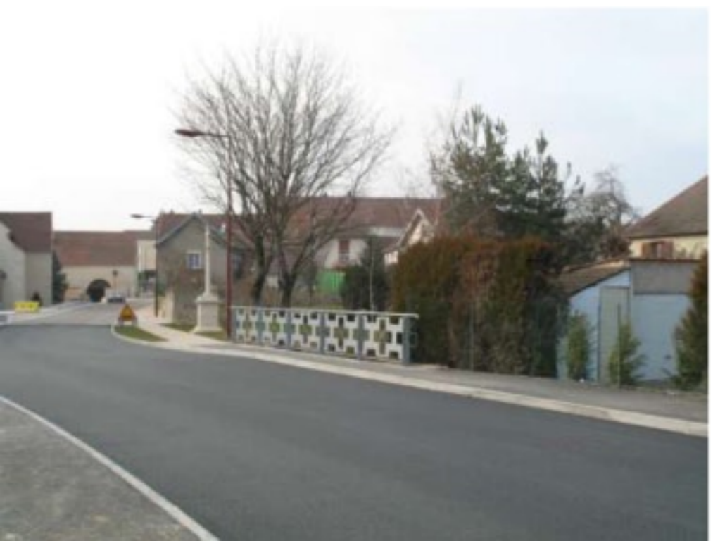
Vue du garde corps métallique et du calvaire