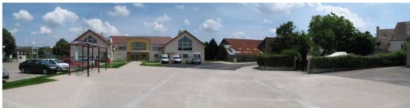
Panoramique projet fini