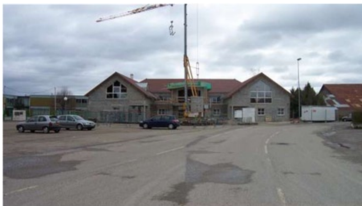
Panoramique projet en cours