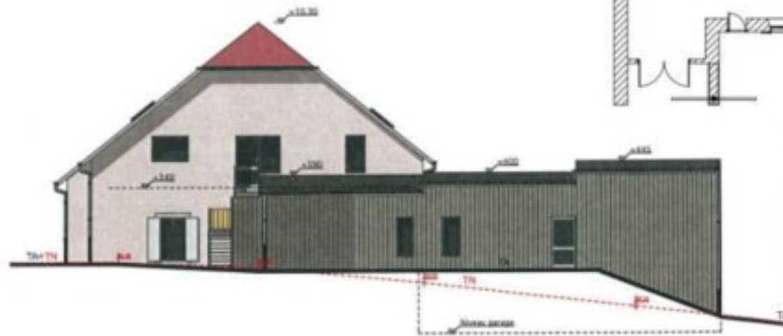
FACADE NORD EST