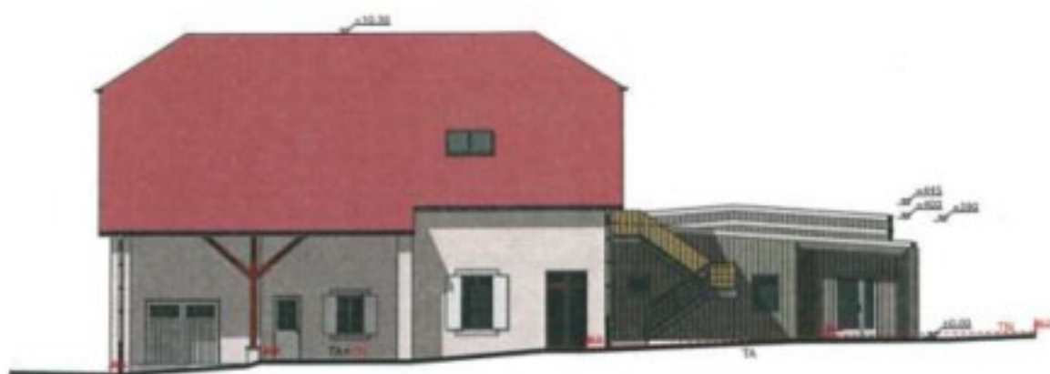
FACADE SUD EST