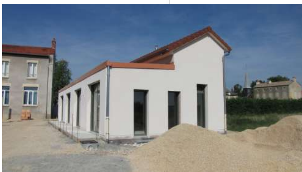
2010 tale on