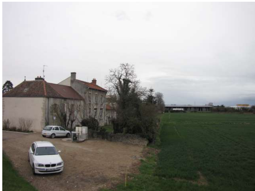
MONTAGNY Ecoles PERPECTIVES

Site scolaire maintenu en activité. Approche environnementale Chaudière gaz haute performance Apports solaires passifs optimisés Revêtement muraux et faux-plafond acoustiques